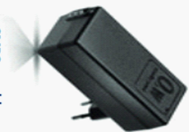
SMPS + cable