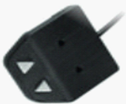
Desk panel (example)